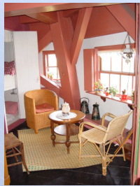
Deels- of Grevensmolen te Vegelinsoord