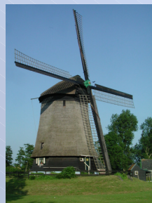
< Molen van Waarland