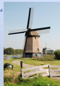
Molen C > Alkmaar